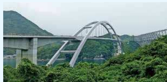
▲③天城橋（三角大矢野道路）※風速15m/sで通行止め