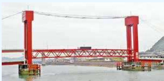
▲②瀬戸歩道橋（本渡）※風速15m/sで通行止め