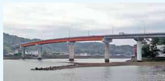
▲⑤天草瀬戸大橋（本渡）