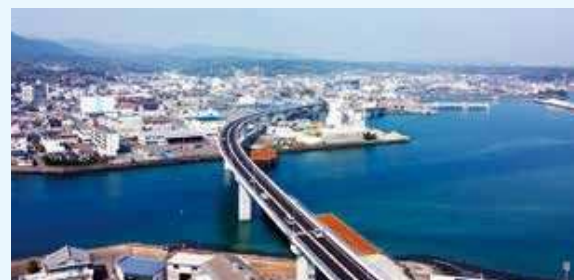
▲①天草未来大橋（本渡道路）※風速15m/sで通行止め