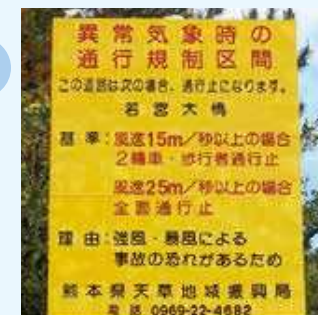
▲通行規制区間を知らせる看板