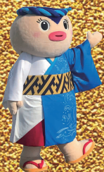
ハイヤ祭りマスコットキャラクター あかねちゃん