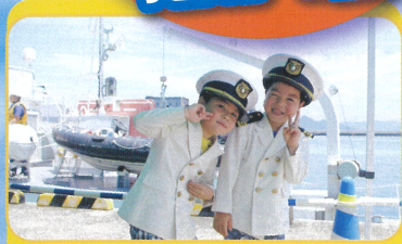
海上保安庁巡視艇 「あそぎり」体験航海