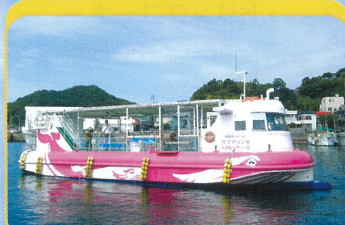
グラスボート体験 特別価格