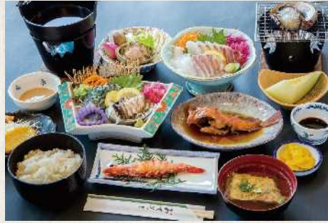
※料理の写真は一例です。

伊勢エビは1匹3,000円からとなります。 その他、ご要望がありましたら、ご予約の際にご注文をお願いいたします。