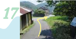
17 細道を抜け本道に合流したら右へ曲がり、川沿いを歩いて崎津集落方面へ