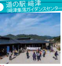
1 道の駅 崎津 (崎津集落ガイドセンター) 駐車場のある道の駅からスタート!観光案内所でより詳しい崎津集落散策マップを手に入れても◎。トイレに寄っておこう