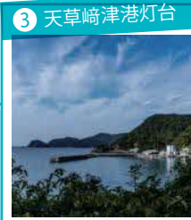
3 天草崎津港灯台 海をはさんで崎津集落が見渡せる撮影スポット。灯台まで進んだら引き返そう