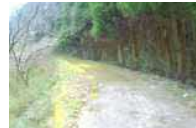
12 しばらく林道を歩きます