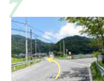
7 川沿いから分かれ道を住宅街のある左へ進みます