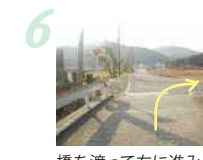
6 橋を渡って右に進み、川沿いを歩きます