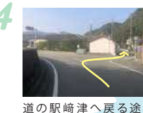
4 道の駅崎津へ戻る途中、右に入ります