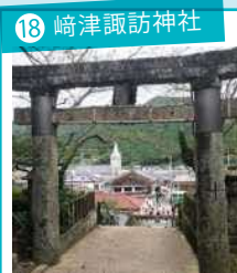
18 崎津諏訪神社 崎津集落の守り神として受け継がれている神社。階段から崎津教会が見下ろせる