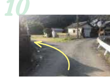
10 今富神社を過ぎて分かれ道を左に進みます