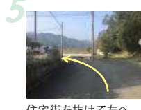
5 住宅街を抜けて左へ