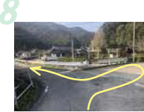
8 前方に今富神社が見えたら橋を渡ってお参り。終わったら橋の手前に戻り、川沿いを歩きます