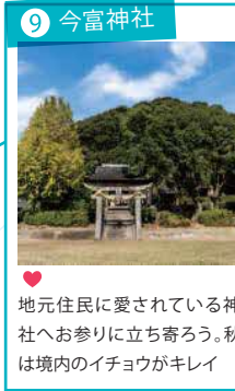
9 今富神社 地元住民に愛されている神社へお参りに立ち寄ろう。秋は境内のイチョウがキレイ