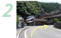
2 分かれ道を右に進みます