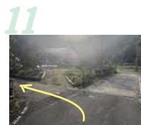
11 また、すぐに左に進み林道の方へ向かいます

※集落内の道路には歩道がありません。道路には広がらず、必ず路側帯を歩いてください。 ※集落内には「トウヤ」や「カケ」など生業にかかわる施設がありますが、その周りには住民の方が生活しておられますので騒がないようにしてください。 ※崎津教会は祈りの場です。室内・外では騒がず、室内は脱帽してください。また、飲食や撮影は禁止です。教会行事を行っている際には、拝観はご遠慮ください。 ※教会拝観には、事前予約が必要です。 ☎096-300-5535(九州産交ツーリズム(株)旅行センター<天草市委託業者>)