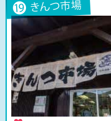
19 きんつ市場 崎津や天草近海でとれた新鮮な水産物や加工品、農産物などを販売。近くにトイレあり