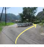
15 右手の橋を渡り、道なりに進みます