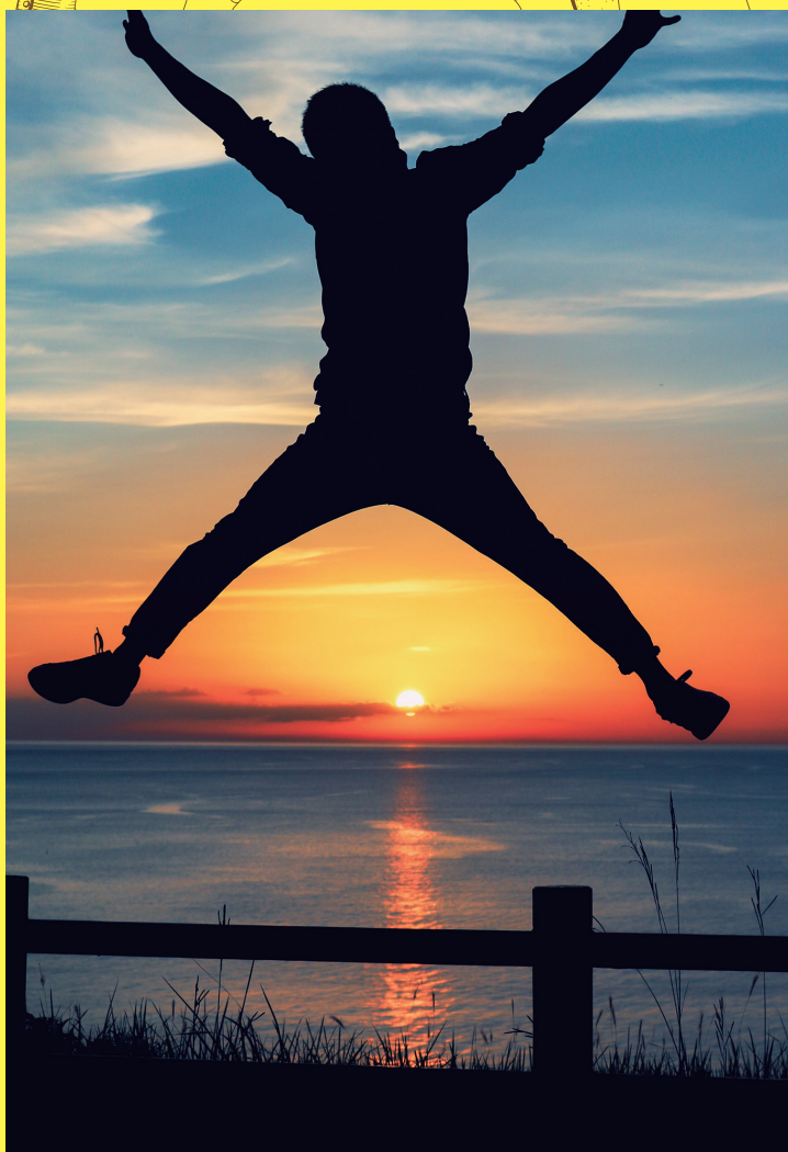
▲令和元年度 最優秀賞「Jump Higher」