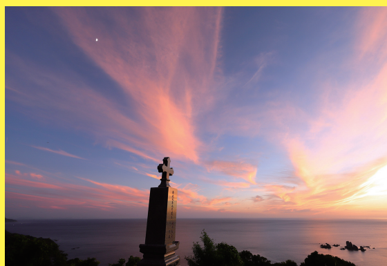
▲優秀賞「天草灘落日」

天草満喫キャンペーンでお得に泊まって 夕陽を撮ろう！ (11月30日(月)宿泊まで)