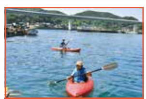
シーカヤック体験会 2KON