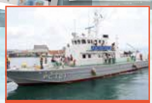
海上保安庁巡視艇「あそぎり」体験航海

天草海上保安署、うしぶかイキキスポーツクラブ、牛深商店街振興組合、熊本パーテナーフレンドシップ、海の駅・道の駅うしぶか海彩館、河浦青年同志会、天草工業高校