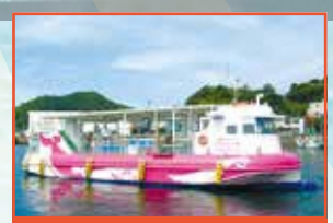
グラスボート体験 特別価格 5KON

※海上保安庁巡視艇「あそぎり」体験航海につきましては、緊急事態発生の際は乗船が取り止めになる場合があります。