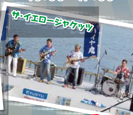
サイエロージャケット