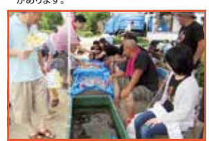
緑日広場 (スーパーボールすくい等)