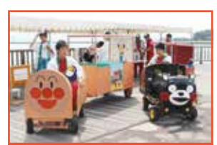
天草工業高校 アンパンマン号・くまモン号