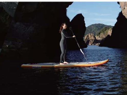
スタンドアップパドルボード (SUP)