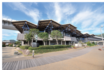
うしぶか海彩館 〒863-1901 熊本県天草市牛深町 2286-116