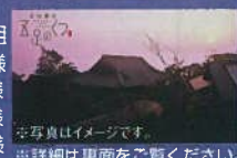
※写真はイメージです。 ※詳細は裏面をご覧ください。